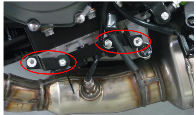
Fitting brackets on the left side