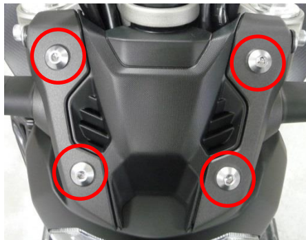
Original screws to unscrew.