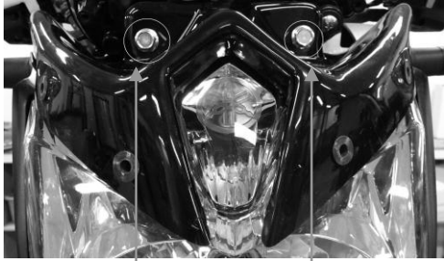
Keeping screw of the taillight and the screen holder

ERMAX NOSE SCREEN ADAPTABLE ON XJ-6 2009 → ∞