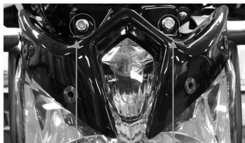
Vis de maintien du phare et du support bulle