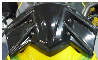
Plastic bracket when attached