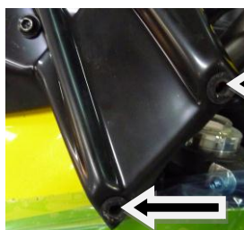
Location of rubber inserts