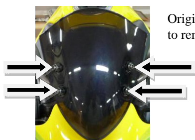
Original screws to remove