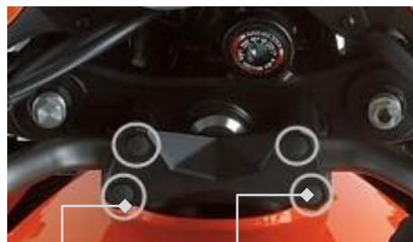
Photo 2 Vis à démonter et à remplacer