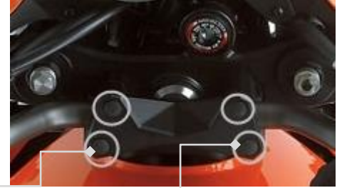
Photo 2 Screws to remove and replace